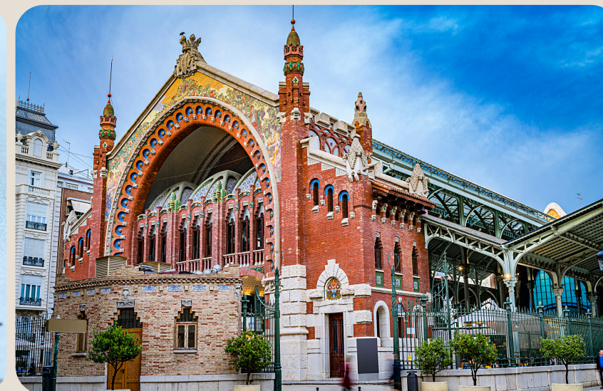
Imagen de innovación y compromiso:

tu empresa se asociará con un evento que impulsa el futuro de la ingeniería.